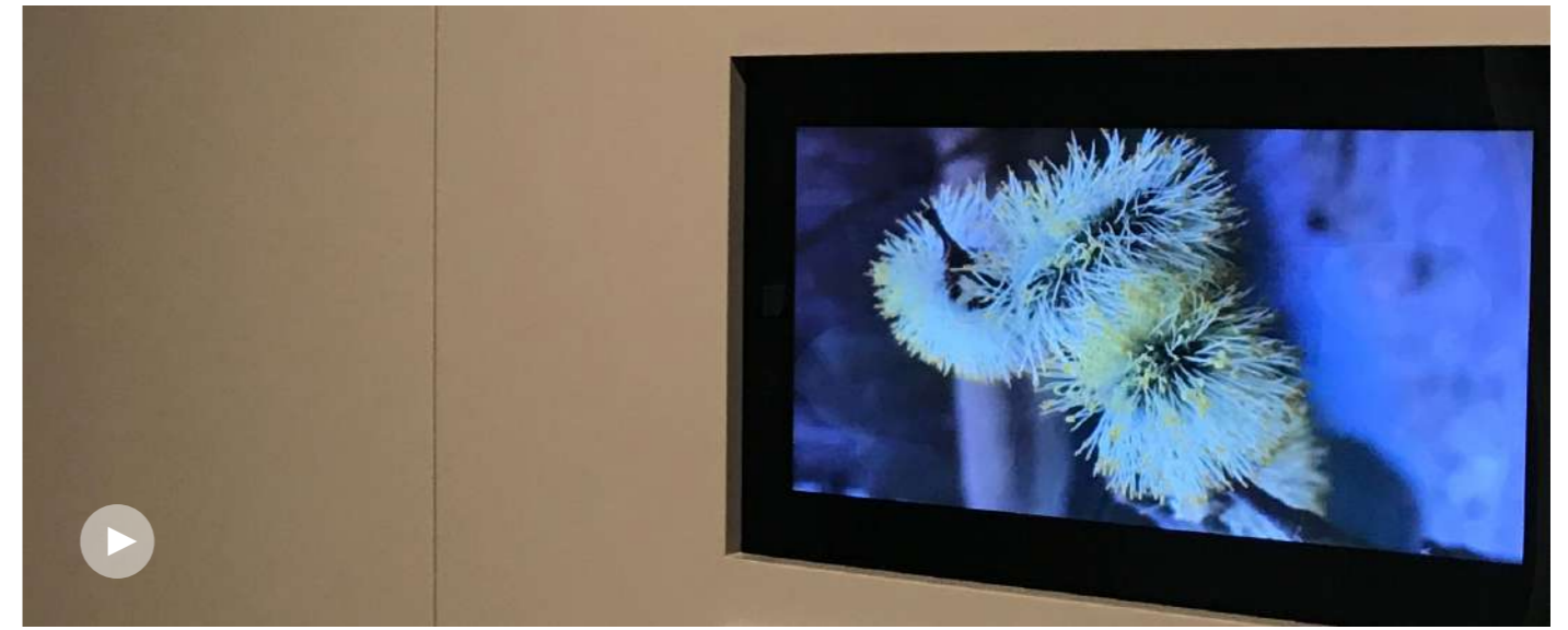
Vidéo « Flânerie végétale » 1'42. Ambiance sonore.