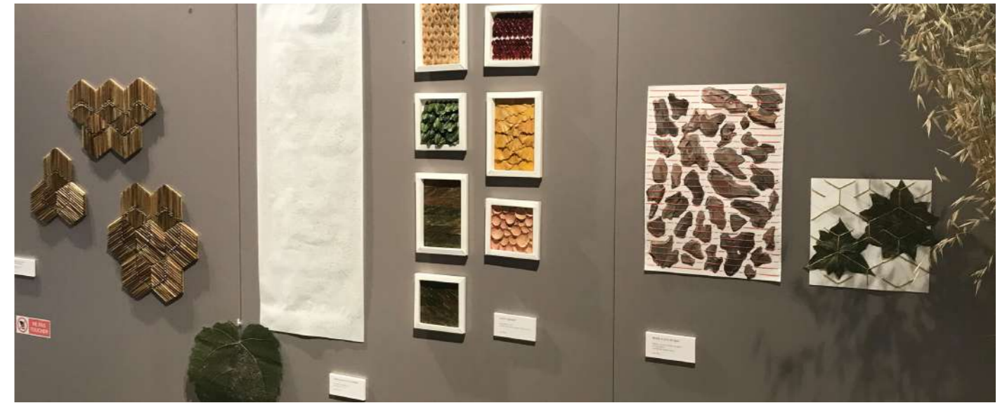
Présentation de compositions dédiés au revêtement mural et à l'habillage d'objet.