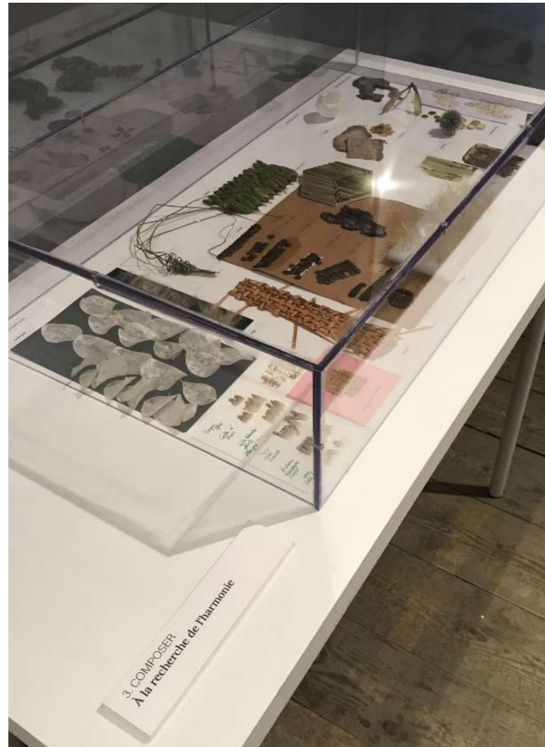
ESPACE PARTIE III - EXPLORER & COMPOSER