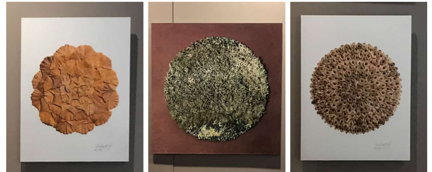
Orbes végétaux, impressions ech.1 sur d'ibond.