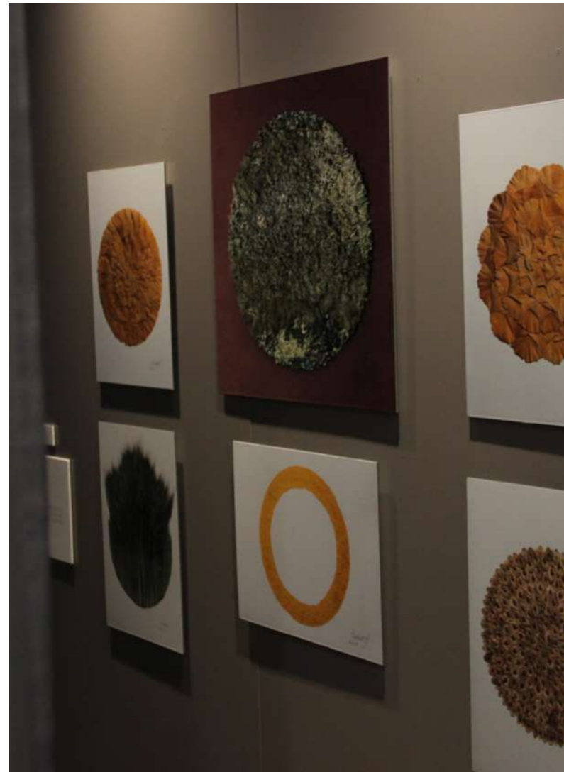
ESPACE ORBES VÉGÉTAUX