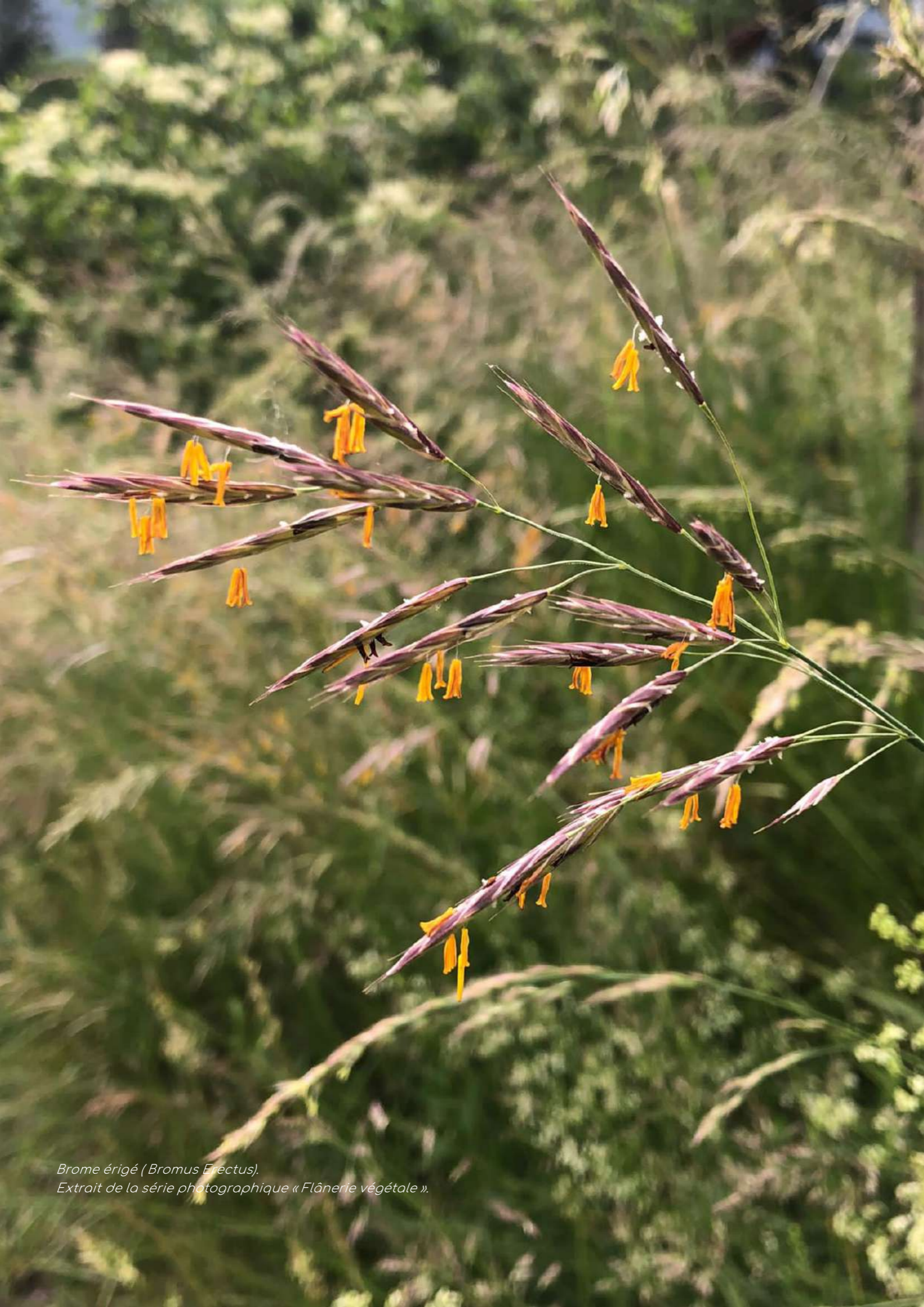
Brome érigé ( Bromus Erectus ). Extrait de la série photographique « Flânerie végétale ».