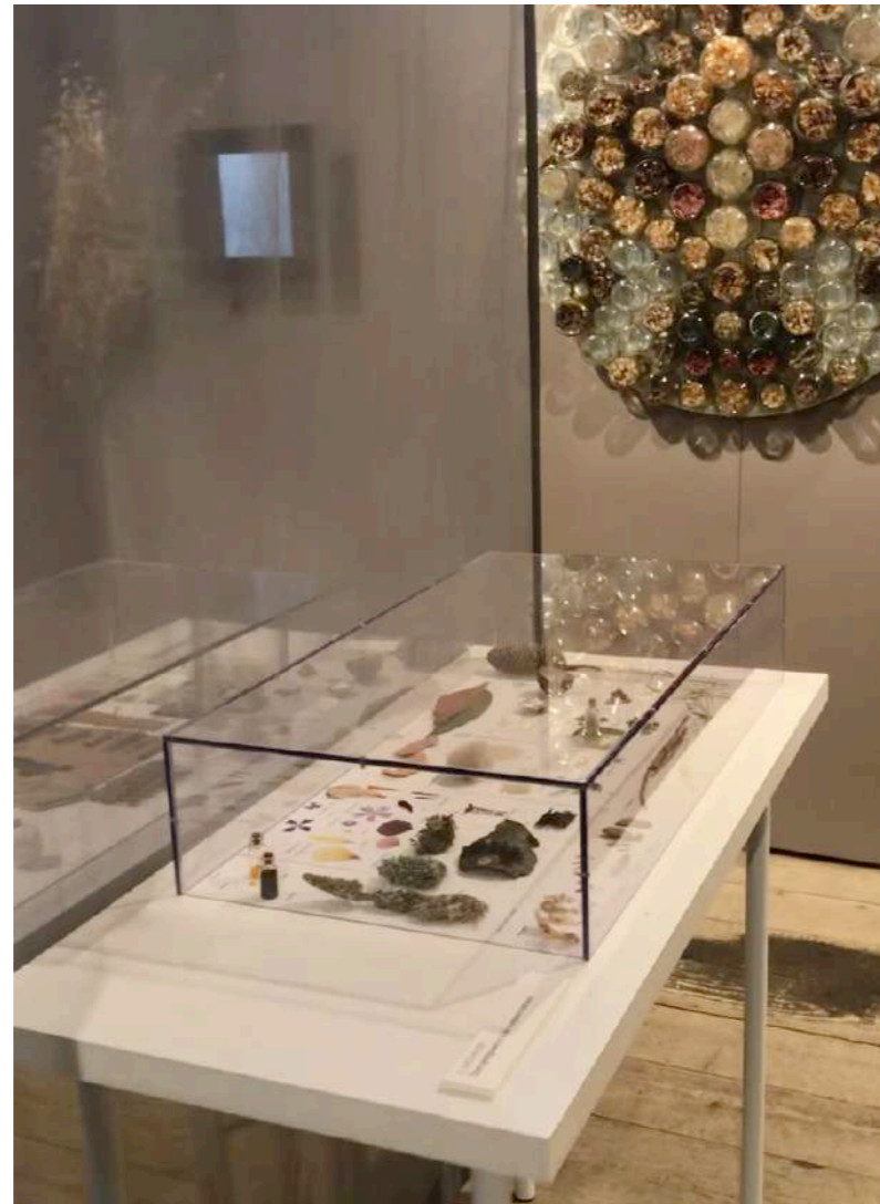
ESPACE PARTIE II - EXPÉRIMENTER & ARCHIVER