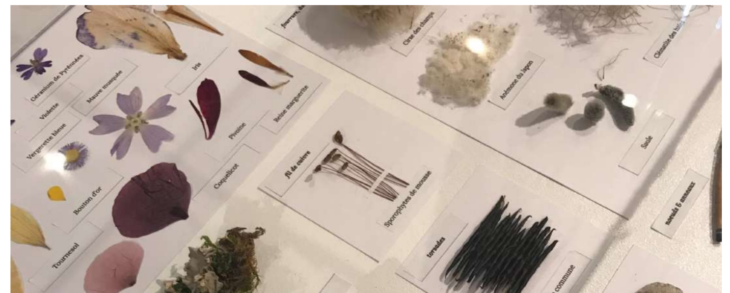
Vitrine botanique. Référencement des espèces par singularité colorielle, texturielle et formelle.