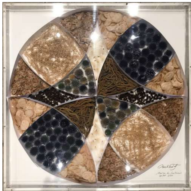
Rosace réalisée à l'occasion de l'exposition « Inspirations végétales », diam. 70 cm. Installation in situ, Maison du Lieutenant, juillet 2024.