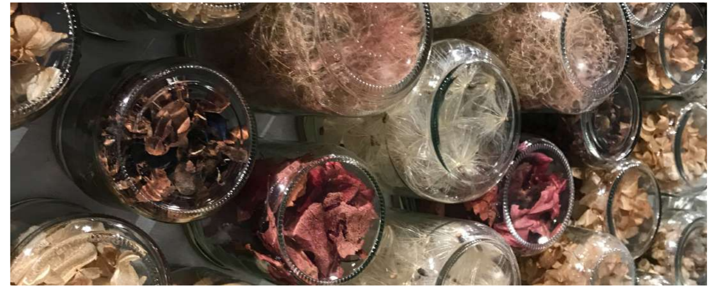
Installation in-situ Orbe Herbier. Détails.