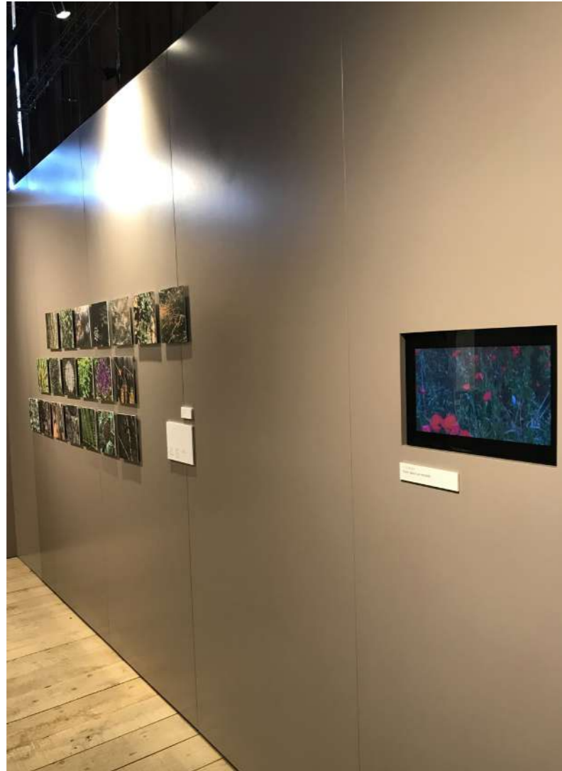
ESPACE PARTIE I - FLÂNER