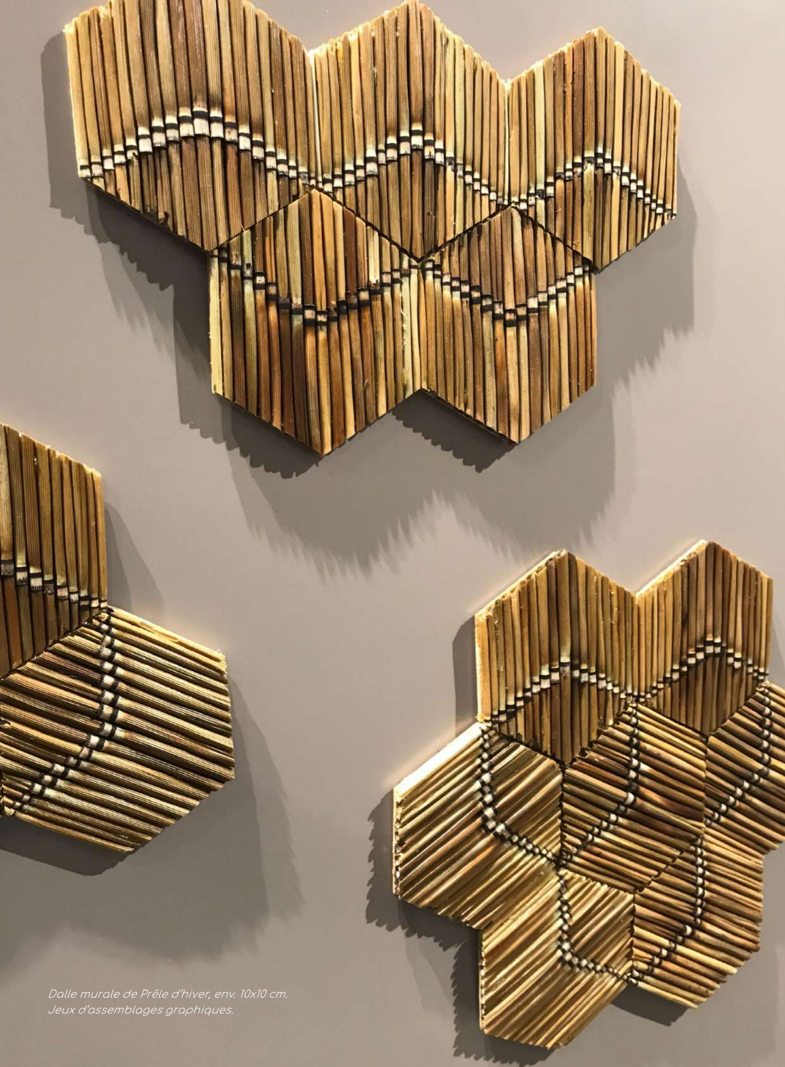
Dalle murale de Prêle d'hiver, env. 10x10 cm. Jeux d'assemblages graphiques.