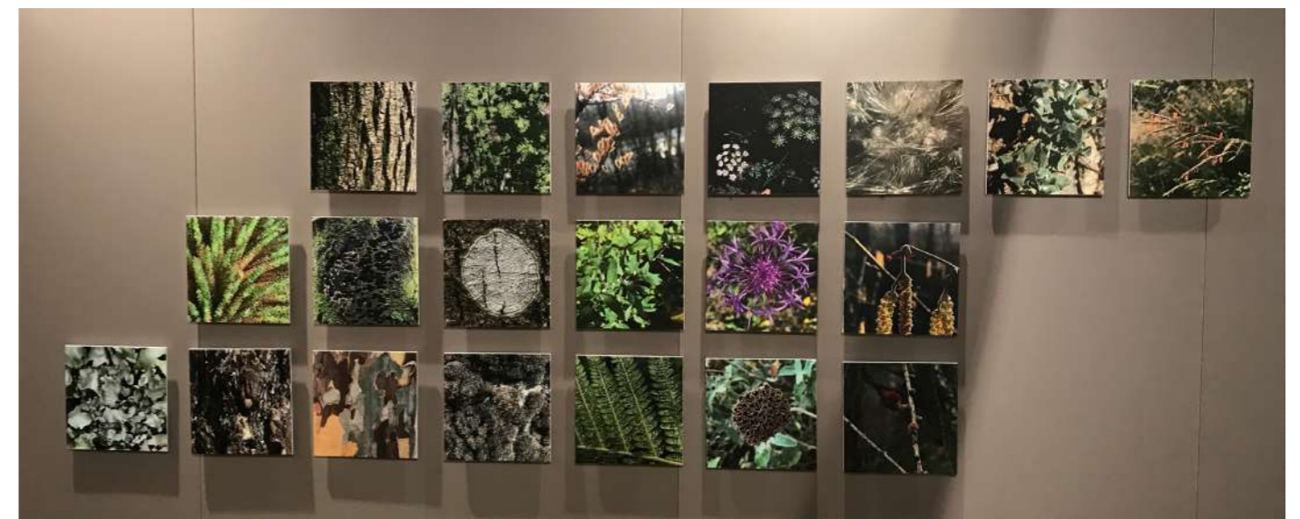
Mosaïque photographique. Impressions sur forex 20x20.