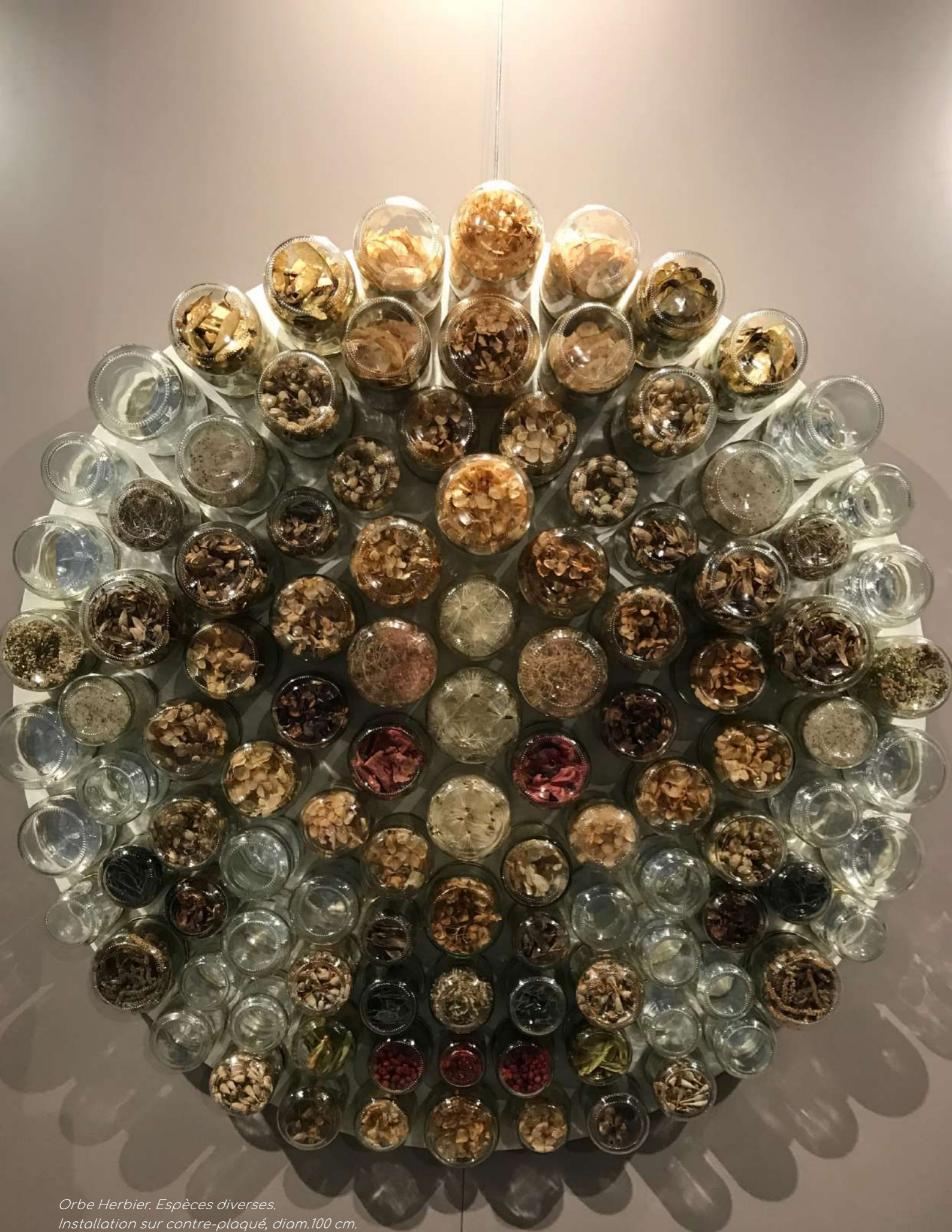
Orbe Herbar. Espèces diverses. Installation sur contre-plaqué, diam.100 cm.