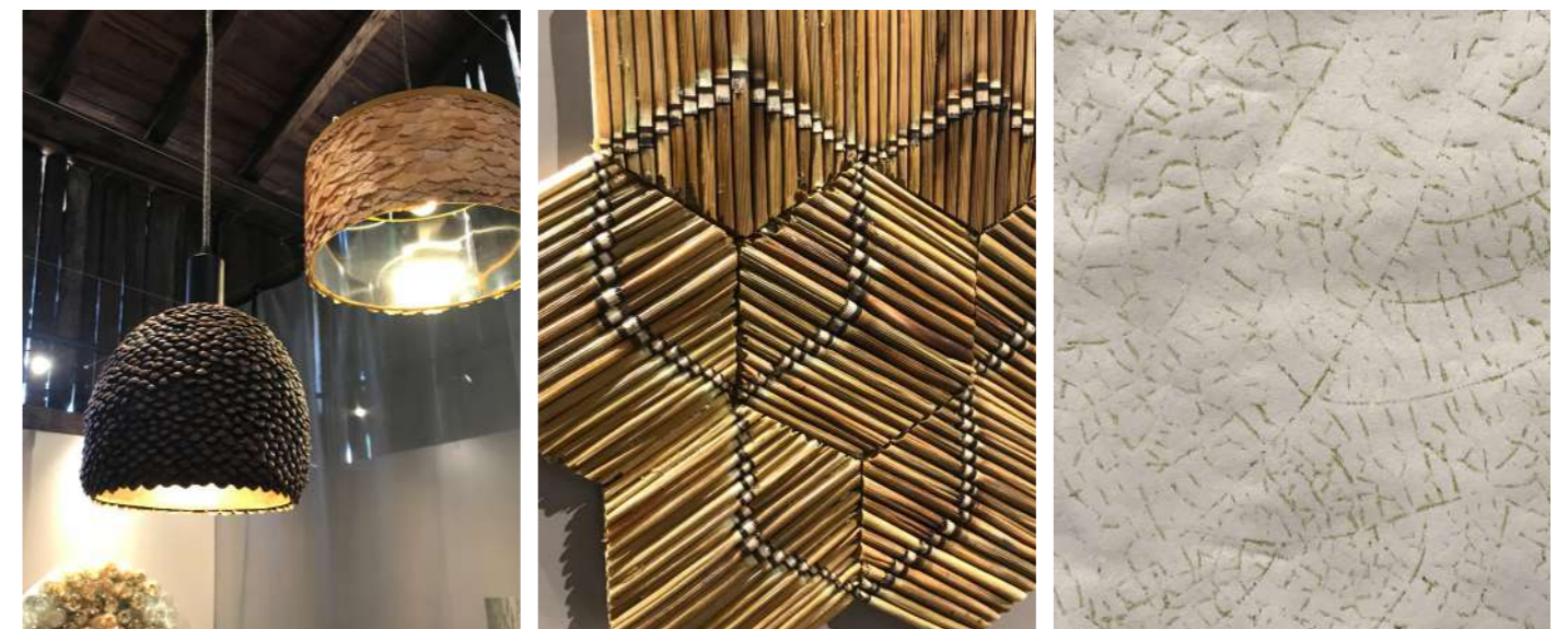
Ci-contre : Vitrine de manipulations, présentant les différents systèmes d'assemblages graphiques élaborés autour de la matière végétale.